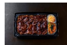
<大阪焼肉・ホルモン ふたご> 名物 ふたご焼肉弁当 本体価格 ¥1,185 税込価格 ¥1,304