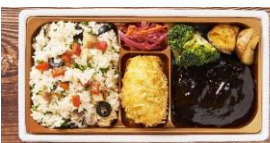
<リッチクリームコロッケ東京> デミグラスビーフハンバーグ& クリームコロッケの彩りご飯御膳 本体価格 ¥1,500 税込価格 ¥1,650