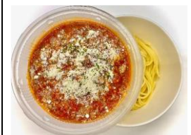
<ECRU> スパゲッティボロネーゼ 本体価格 ¥800 税込価格 ¥880