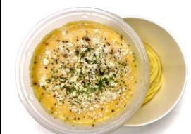
<ECRU> スパゲッティカルボナーラ 本体価格 ¥780 税込価格 ¥858