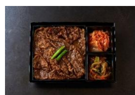
<大阪焼肉・ホルモン ふたご> 黒毛和牛の特上焼肉弁当 本体価格 ¥1,601 税込価格 ¥1,761