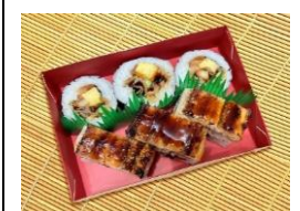
<焼穴子 下村商店> 焼穴子寿司詰合せ 本体価格 ¥1,600 税込価格 ¥1,760