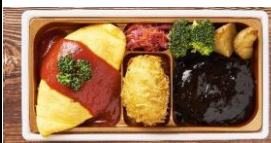
<リッチクリームコロッケ東京> デミグラスビーフハンバーグ& クリームコロッケのオムライス御膳 本体価格 ¥1,600 税込価格 ¥1,760