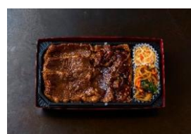
<大阪焼肉・ホルモン ふたご> 牛ロースとふたご焼肉W弁当 本体価格 ¥1,277 税込価格 ¥1,405