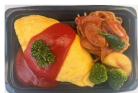
<リッチクリームコロッケ東京> 洋食屋さんのオムライスプレート 本体価格 ¥900 税込価格 ¥990