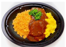
<ECRU> ふわふわ卵のハンバーグオムライス 本体価格 ¥720 税込価格 ¥792