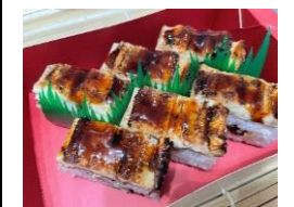
<焼穴子 下村商店> 焼穴子 押寿司 本体価格 ¥1,600 税込価格 ¥1,760