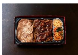
<大阪焼肉・ホルモン ふたご> 牛タン塩とふたご焼肉W弁当 本体価格 ¥1,277 税込価格 ¥1,405