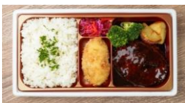
<リッチクリームコロッケ東京> デミグラスビーフハンバーグ& クリームコロッケ御膳 本体価格 ¥1,277 税込価格 ¥1,405