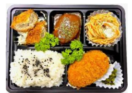
<ECRU> サクッとシューシーメンチ& とろけるカニクリームコロッケ弁当 本体価格 ¥830 税込価格 ¥913