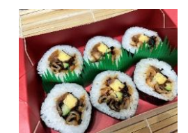
<焼穴子 下村商店> 焼穴子 上太巻 本体価格 ¥1,600 税込価格 ¥1,760